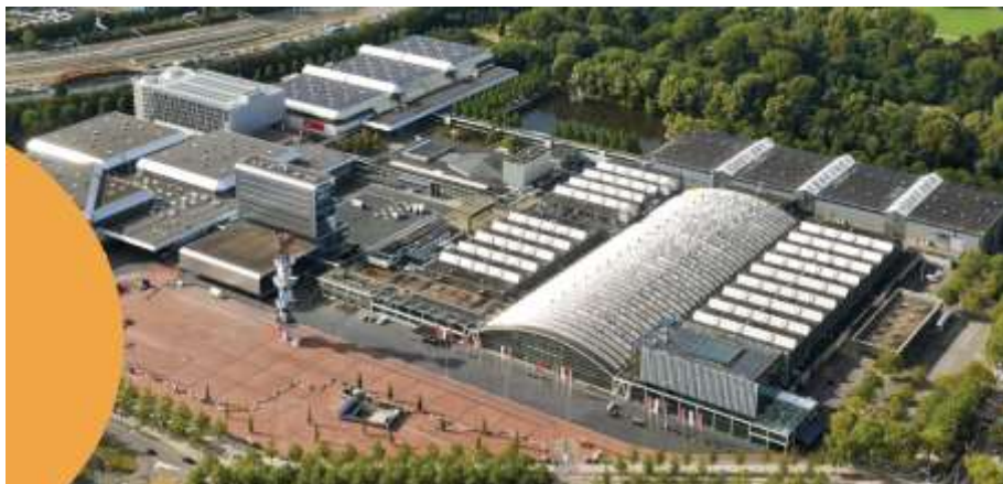
Imagem II: Centro de Convenções RAI/Amsterdã: Local das apresentações das Performances de Grupo; Refeitório (almoço e jantar), Noites Nacionais e FIG GALA.