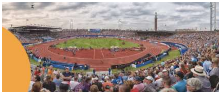
Imagem I: Estádio Olímpico de Amsterdã: onde serão as cerimônias de abertura, encerramento e performances de grande área