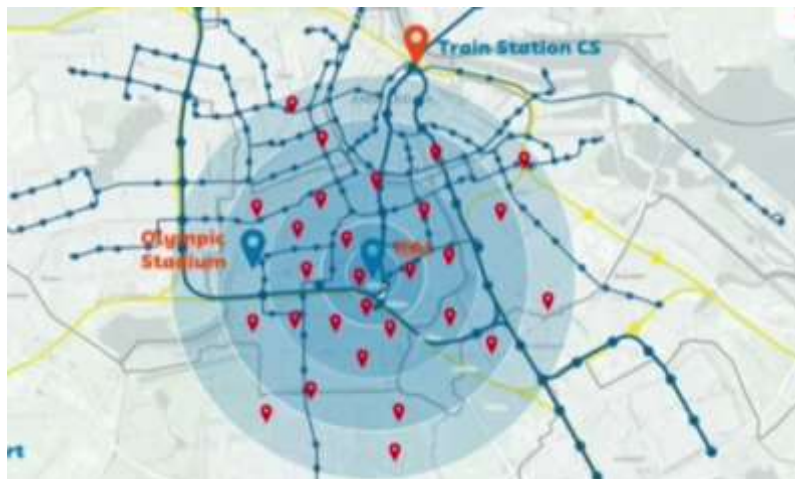
Imagem IV: Localização das escolas, locais de apresentação e o sistema de transporte